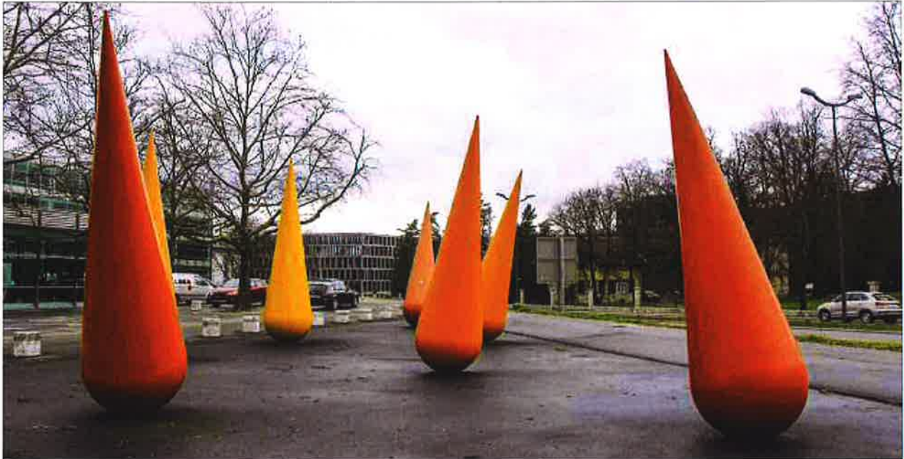
Kulturelles Engagement: Auch der Erwerb der Tropfenplastik von Herbert Distel war durch die Stiftung zur Förderung der HTL ermöglicht worden